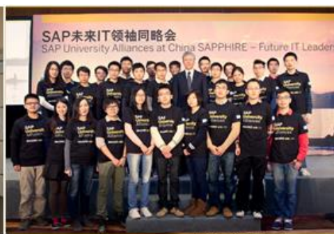
2013 年 SAP HANA 达人校园大赛