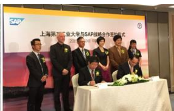
SAP 与上海第二工业大学签署战略合作协议