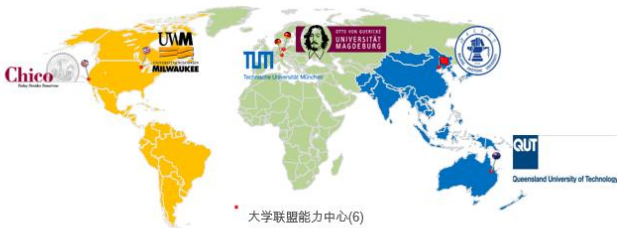
全球 6 所大学能力中心覆盖图

2013 年 11 月 20 日，思爱普公司（SAP）与北京交通大学在北京国家会议中心正式签署协议，决定共建全球第六家、亚洲第一家大学能力中心，。