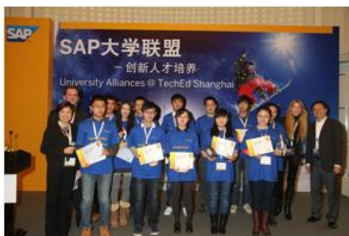
2012 年 SAP Dashboard 大赛