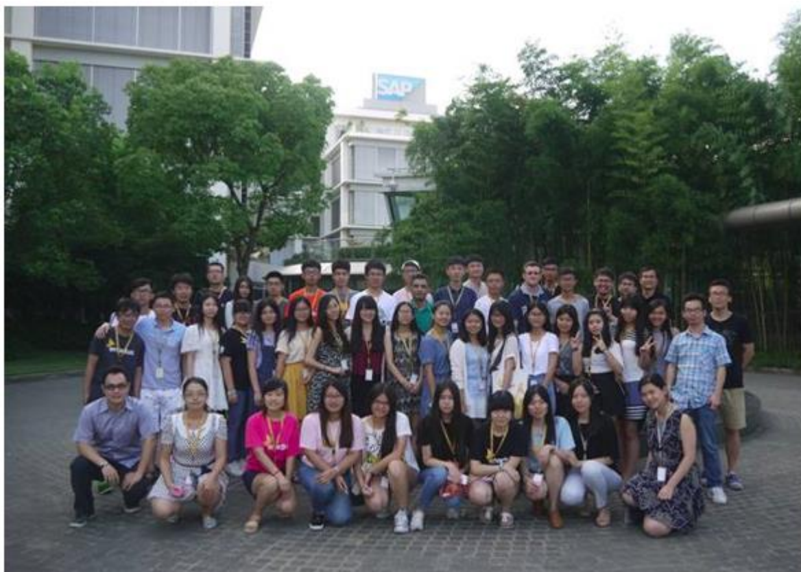
来自全国各高校的“创行”学生队长参与设计思维课程