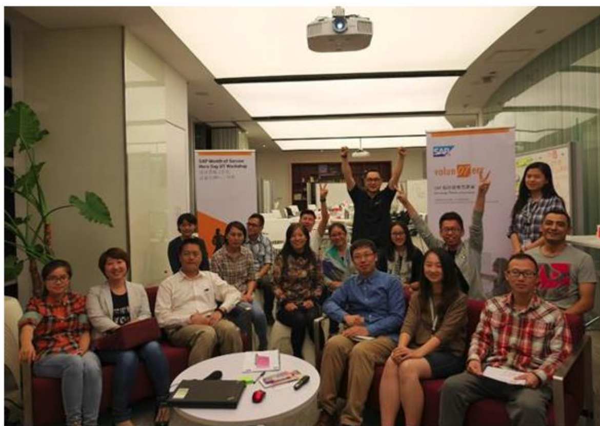
帮助公益组织项目负责人运用设计思维方法于实际运营