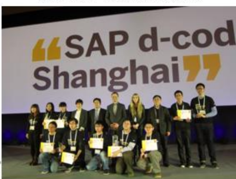
2014 年 SAP Lumira 大学挑战赛