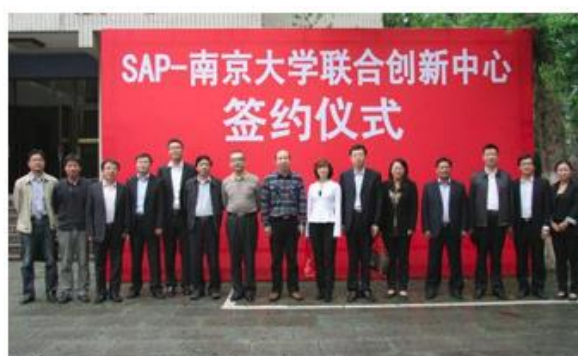
SAP 与南京大学联合创新中心

结合最前沿的信息技术和主题，如大数据，工业 4.0，云计算等，与高校开展联合创新的探索。