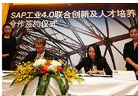
SAP 与同济大学建立创新合作