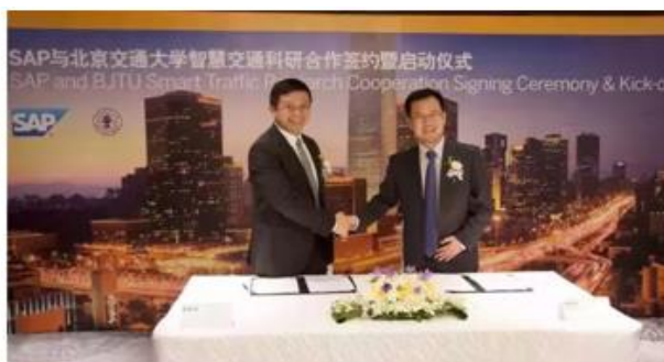
SAP 与北京交通大学建立智慧交通科研合作